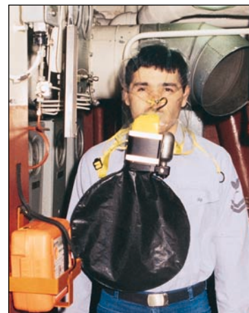
L'EEDB Ocenco M-20.2 montré est prêt à être utilisé pour l'évacuation.

Du fait de sa compacité, l'EEDB Ocenco M-20.2 peut être porté à la ceinture dans tous les endroits confinés.